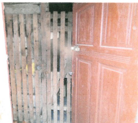
Drzwi wejściowe do piwnicy