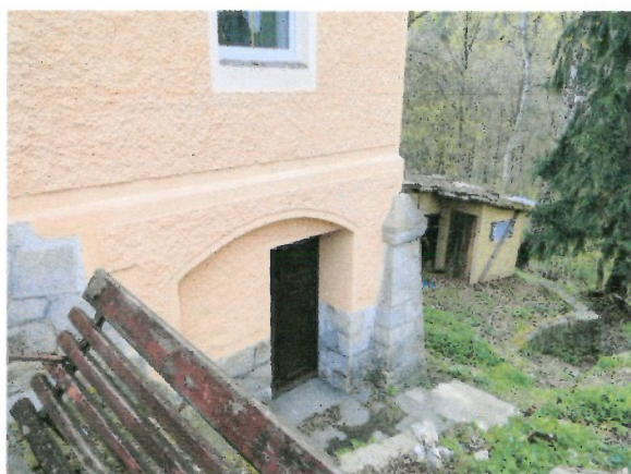
Wejście do piwnicy