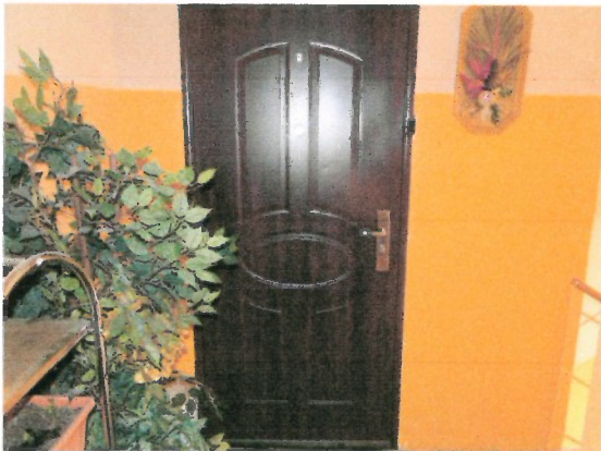
Drzwi wejściowe do lokali 9 i 10