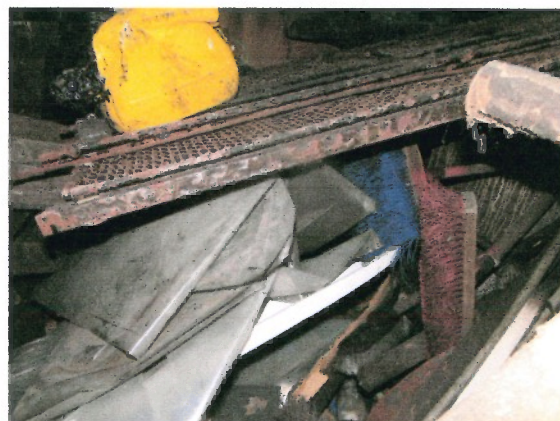
Zagracona komórka w piwnicy należąca do wycenianego lokalu nr 10 o góry