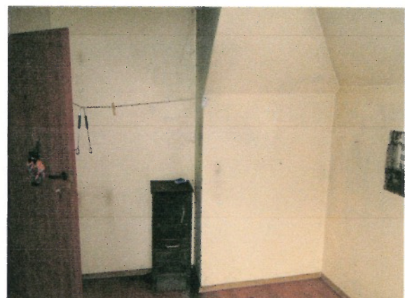
Rzut na drzwi i piec od wewnątrz lokalu