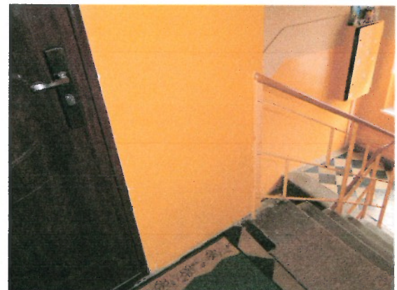
Drzwi do komunikacji lokalu nr 10