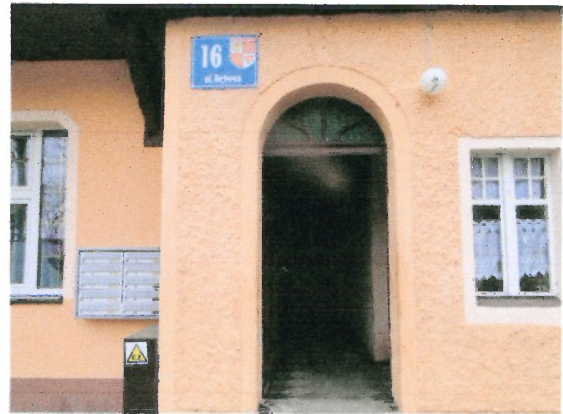
Drzwi wejściowe do budynku